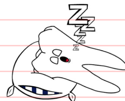
Med dagens moderne tannbehandling er det en selvfølge at behandlingen skal være smertefri.

I avtrykkene helles det gips. Når gipsen har stivnet, har vi en perfekt kopi av tennene dine, som vi kan lage en ny tann på. Vi benytter ulike teknikker for å fremstille en krone. Det vanligste er at et tannteknisk laboratorium først lager den indre delen av kronen i et meget hardt keramisk materiale. Den indre delen står for styrken. For å få et pent og naturlig utseende på kronen legger tannteknikeren skiktvis tynt lag med porselen utenpå dette. Porselenet brennes og herdes fast under høy temperatur og trykk. Prosessen gjør porselenet meget holdbart og emaljelikt. Hver liten krone blir et kunstverk for seg. Laget med meget høy presisjon, spesielt tilpasset den enkelte pasient.